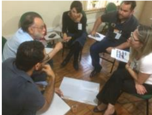
Imagem 3: Capacitação no CAEP – Estilos de Aprendizagem para Professores