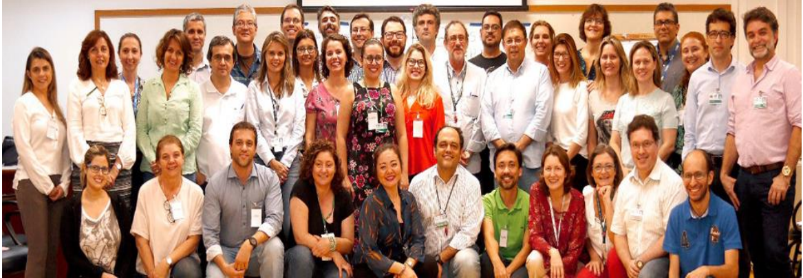
Imagem 1: III turma de participantes do MB-CDDE 2018

1. Módulo Básico de Educação para Profissionais de Saúde – MB-CDDE , que tem duração de cinco semanas e atividades presenciais e a distância. Os principais temas abordados no curso foram: Princípios de aprendizagem de adultos; Noções essenciais sobre planejamento e implementação de currículos; Estratégias efetivas de ensino e aprendizagem; Avaliação do estudante (somativa, formativa e diagnóstica) nos domínios cognitivo, psicomotor e afetivo; Avaliação de programas educacionais e Elementos de gestão de programas educacionais. O MB-CDDE conta com atividades presenciais (20hs), a distância no STOA-USP (10 horas) e uma proposta de intervenção que deve ser elaborada pelos participantes (10 horas), para que utilizem alguns dos conceitos e ferramentas que aprenderam em sua prática docente. A carga horária total do Módulo Básico foi de 40 horas, e neste ano foi oferecido como um curso de atualização da Pró Reitoria de Extensão da Universidade de São Paulo (PRCEU-USP), cadastrado no Sistema Apolo.