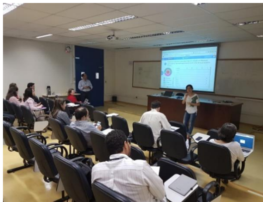
Imagem 4: Capacitação no Bloco Didático – Aulas interativas