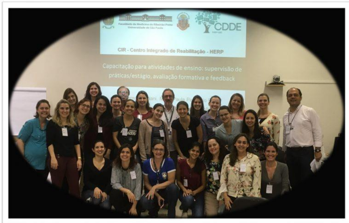
Imagem 2: Capacitação no CIR-HERibeirão