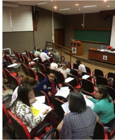
Imagem 5: Capacitação no Anfiteatro da Bioquímica – TBL e Flipped classroom