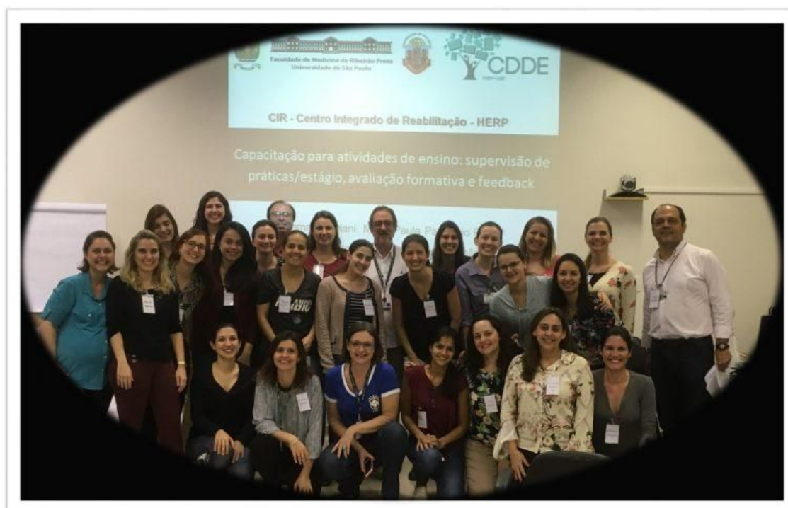
Imagem 2: Capacitação no CIR-HERibeirão