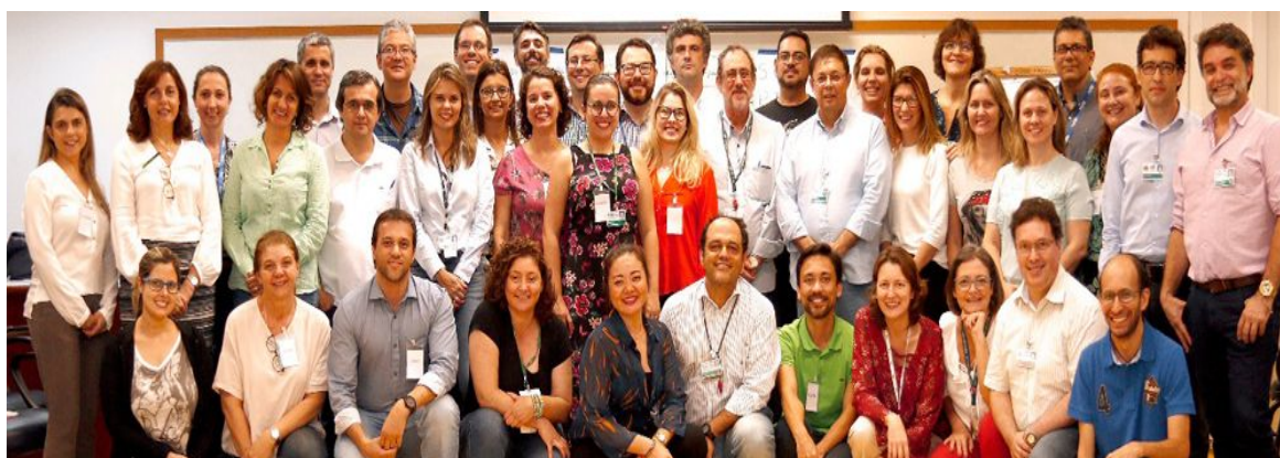
Imagem 1: III turma de participantes do MB-CDDE 2018

5yuxb VduNlyZfZI {nyXn'uxk Zbn'yZk Zy(xZ XZ'UUá' nVAt ©