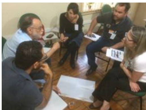
Imagem 3: Capacitação no CAEP – Estilos de Aprendizagem para Professores

Foram 8 horas presenciais (em dois sábados pela manhã) e 4 horas de atividades à distância no STOA –USP. A carga horária total desta oficina foi de 12 horas e foi oferecida como um curso de difusão da Pró Reitoria de Extensão da Universidade de São Paulo (PRCEU-USP), cadastrado no Sistema Apolo.