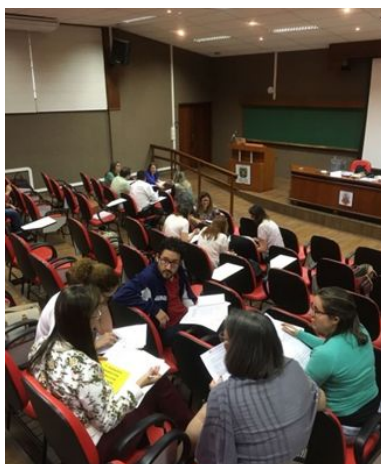
Imagem 5: Capacitação no Anfiteatro da Bioquímica – At 1Z' jbuZX'VMjyrnk